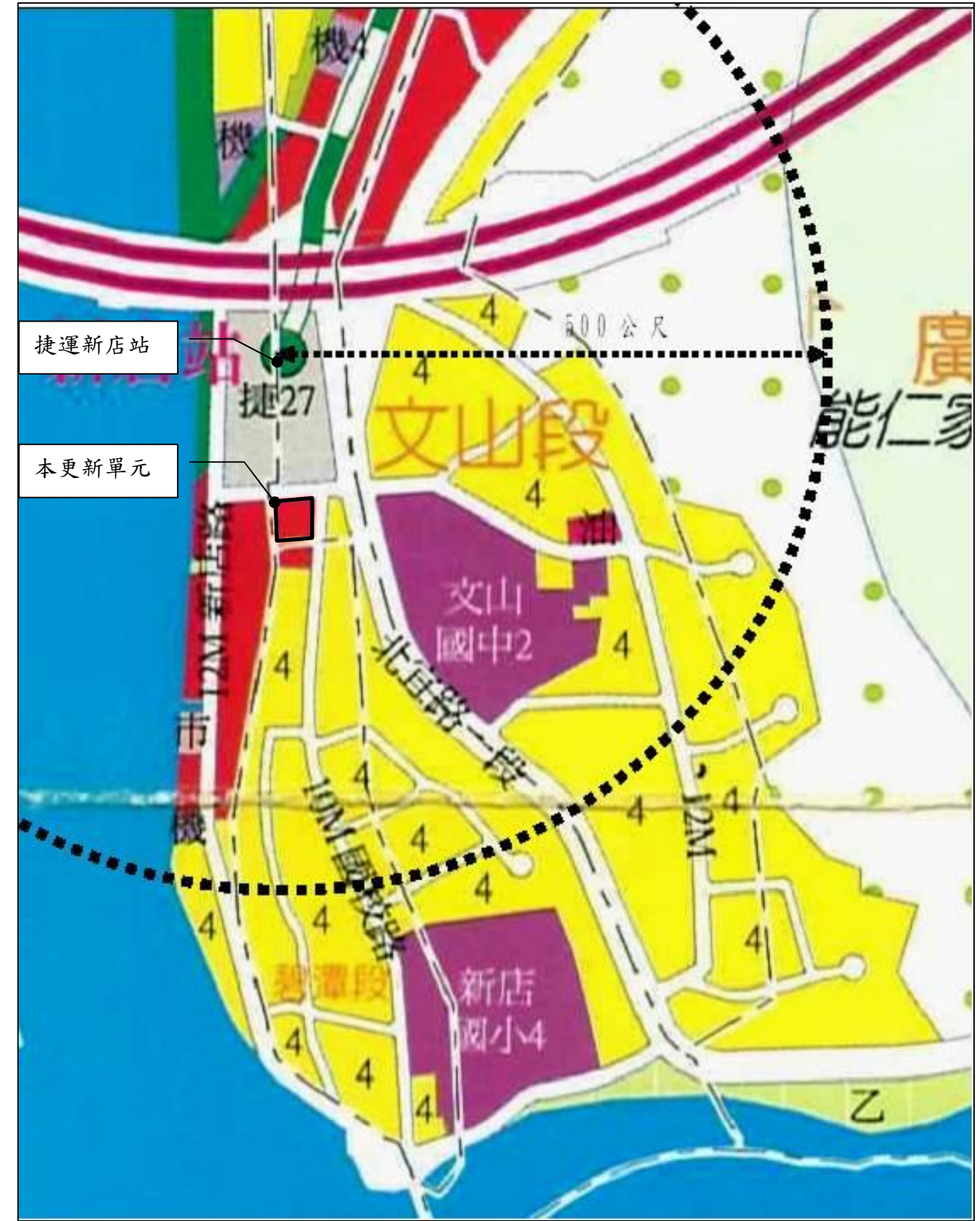
圖 6-1 新店都市計畫圖